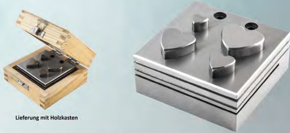
Lieferung mit Holzkasten